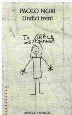
PAOLO NORI Undici treni