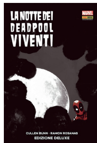
LA NOTTE DEI DEADPOOL VIVENTI EDITORE: PANINI PREZZO: € 9,90