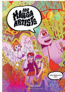
100 MANGA ARTISTS EDITORE: TASCHEN PREZZO: € 14,99