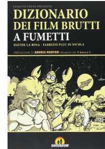
DIZIONARIO DEI FILM BRUTTI A FUMETTI EDITORE: SHOCKDOM PREZZO: € 8,50