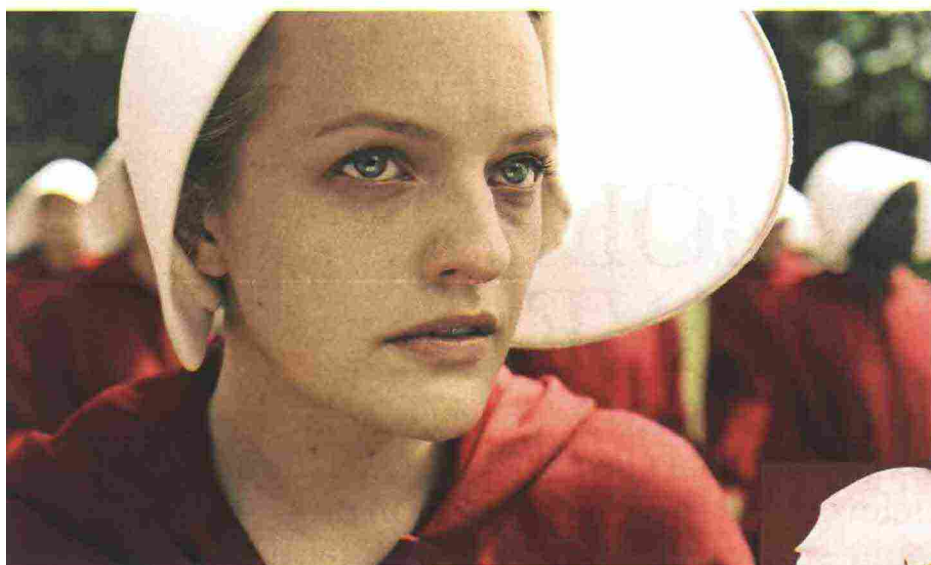
Sopra, Elisabeth Moss in The Handmaid's Tale (Il racconto dell'ancella): la seconda stagione arriverà su Timvision nell'aprile 2018. A fianco, il libro edito da Ponte alle Grazie da cui è tratta la serie.