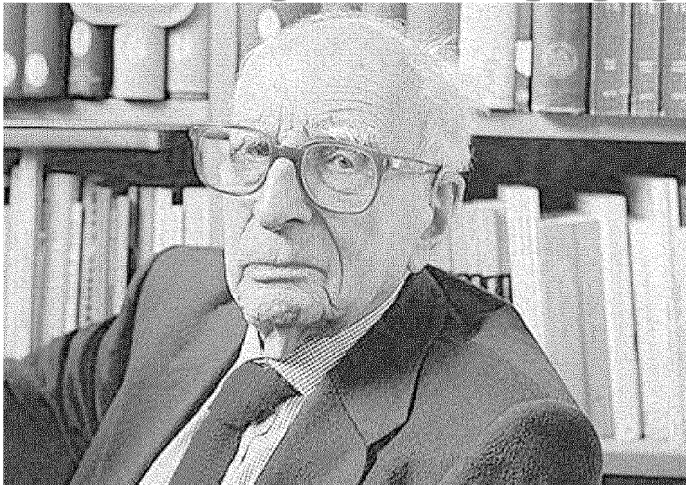
Nato a Bruxelles il 28 novembre 1908 da genitori alsaziani, Claude Lévi-Strauss ha insegnato per 23 anni antropologia sociale al Collège de France