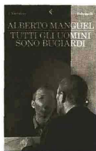
Novità in libreria «Tutti gli uomini sono bugiardi» di Alberto Manguel (Feltrinelli, 172 pagine, 14 euro).