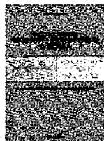
ALBERTO PAOLUCCI "Piccole targhe su..." Palombi Euro 15

QUESTO libro raccoglie le iscrizioni indicanti proprietà di confraternite e congregazioni religiose, esposte sulle case della città storica. Sono piccole targhe che testimoniano l'impegno sociale verso i poveri e i pellegrini bisognosi di ospitalità che da tante parti dell'Europa affluivano a Roma. L'intensa attività di aiuto e assistenza contribuisce allo sviluppo urbano con l'edificazione di ospedali, ospizi e abitazioni, oltre che di grandi opere destinate al culto. Percorrere la città alla ricerca di questi simboli di pietra consente di apprezzare una parte minore ma importante del suo patrimonio storico e artistico.