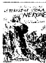
ANDREA GIARDINA "La terribile storia..." Laterza Euro 12

mente era stato: un sovrano certo crudele e segnato da una vena di follia, ma anche geniale, che aveva interpretato in modo nuovo il mestiere terribilmente difficile dell'imperatore romano". Nerone è il protagonista di un racconto che si fa leggere tutto d'un fiato. I veneni di corte, le amanti e l'incendio di Roma fino alla decisione di togliersi la vita da solo.