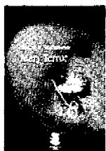
ROBERT MCCAMMON "Mary terror" Gargoyle Euro 16