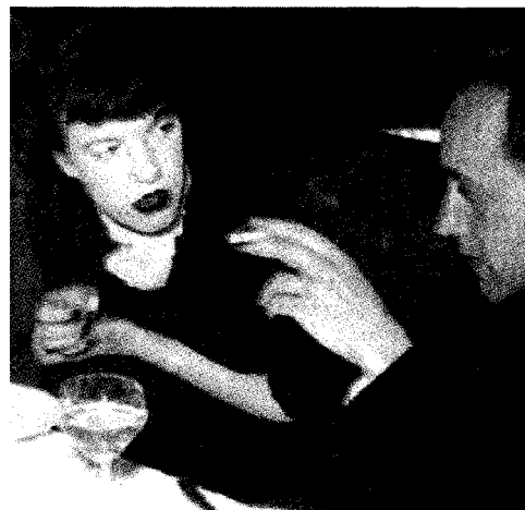
Ingeborg Bachmann con Paul Celan

In «Microliti» e nei versi di «Oscurato», la poesia come estremo rifugio, ultimo custode della solitudine