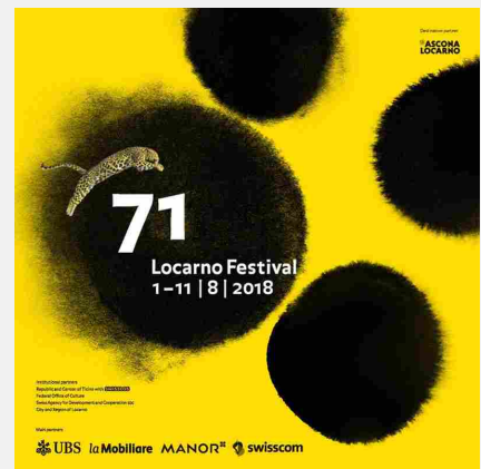
LOCARNO FESTIVAL 2018