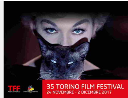
35 TORINO FILM FESTIVAL