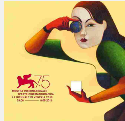
75 FESTIVAL DEL CINEMA DI VENEZIA