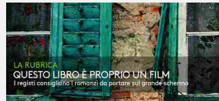
QUESTO LIBRO È PROPRIO UN FILM