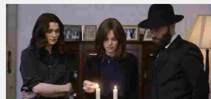
DAL LIBRO AL FILM / PRIMO PIANO / RECENSIONE

Frankenstein, King Kong & Co. L'horror da antologia del dr. Carelli