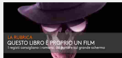
PRIMA PAGINA / QUESTO LIBRO È PROPRIO UN FILM