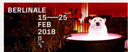
68 FESTIVAL DEL CINEMA DI BERLINO