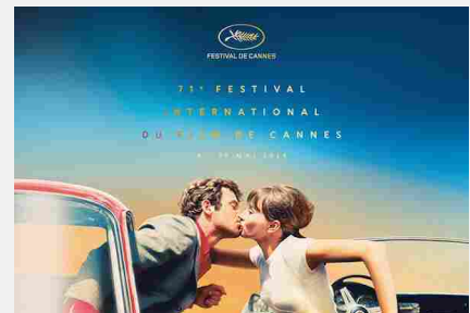
71 FESTIVAL DEL CINEMA DI CANNES