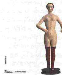
VIAGGIO INTORNO ALLA MADRE Ornela Vorpsi, Nottetempo, pag. 120, € 12