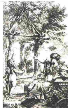
MARC-ANTOINE LAUGIER "LA CASA PRIMITIVA" DALL'ESSAI SUR L'ARCHITECTURE, 1755

pensiamo di poterci rifugiare e in cui costruire frammenti sicuri della nostra esistenza, la memoria più resistente in una quotidianità fatta di continui cambiamenti - è probabilmente il fenomeno su cui si sta meno riflettendo in questo primo quarto di secolo. [...] La casa è oggi uno dei luoghi universali da cui ripensare noi stessi e il mondo che abitiamo. È diventata, di fatto, un reale laboratorio di comprensione e trasformazione del mondo". Dalla "casa come specchio dell'anima", secondo la massima di Mario Praz, si giunge qui alla casa assunta non solo "come luogo definito, ma come un nuovo paesaggio, un luogo instabile e multiforme che cambia continuamente [...], un luogo abitato da oggetti che cambiano insieme ai suoi abitanti-consumatori". Attraverso sette temi di riferimento (la casa solida, dominante, sacra, trasparente, democratica, senza radici, invisibile) si arriva a suggerire che "le case che noi siamo sono il laboratorio politico e sociale aperto sulle nostre vite e sul modo di abitare il mondo che ci circonda".