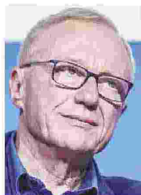
» La vita gioca con me David Grossman Mondadori