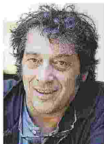
» Il colibri Sandro Veronesi La nave di Teseo