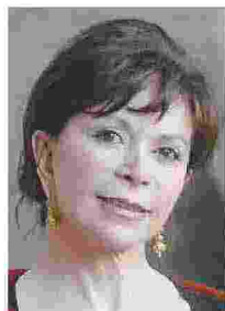
» Lungo petalo di mare Isabel Allende Feltrinelli