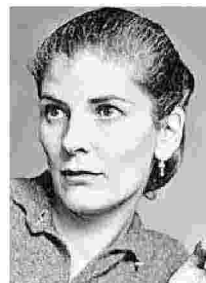
» Le mezze verità Jane Howard Fazi