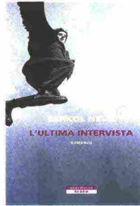
L'ultima intervista Eshkol Nevo, Neri Pozza, 18 euro

✓ Eshkol Nevo, acclamato scrittore israeliano, racconta senza abbellimenti la sua vita, rispondendo a una serie di domande a tutto campo: fallimenti compresi, invidie, paure, inadeguatezze, struggimenti, dolori. Una vita come tante, paradigmatica negli innamoramenti, nella perdita degli amici, nelle difficoltà coniugali e nei complicati rapporti con i genitori, eppure totalmente a se stante: perché Nevo non è uno di noi, anche se siamo tentati di crederlo, ma uno scrittore. E il mestiere di scrivere lo condanna a un pensare incessante che si, alimenta ciò che scrive e lo arricchisce, ma lo logora nel medesimo tempo. Arrivati in fondo, ci si chiede quale sia lo scopo del libro. Forse umanizzare un grande della scena letteraria; forse permettere a tutti di lanciare uno sguardo sulla creatività, infinita bellezza e fatica.