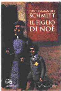
Il figlio di Noè Eric-Emmanuel Schmitt, Edizioni e/o 14 euro

✓ Difficile pensare che una vicenda ambientata in piena Seconda Guerra mondiale, in cui il personaggio principale è un bambino ebreo di 7 anni strappato ai genitori e alloggiato in un orfanotrofio per sfuggire alle persecuzioni naziste, possa strapparci un sorriso e commuoverci più che rattristarci. Eppure questa storia, raccontata in un contenuto numero di pagine scritte in modo piano, addirittura lieve, che in certi punti sfiora addirittura la comicità, riesce nella difficile missione di intenerirci e raccontarci la verità, di farci sperare nell'umanità nello stesso momento in cui dovremmo disperare. Protagonisti, il piccolo Joseph, il suo amico più grande Rudy e Padre Pons, un impareggiabile sacerdote che non si limita a salvare delle vite, ma ne protegge le culture di appartenenza e le memorie.