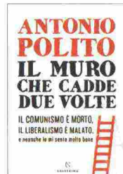
Il muro che cadde due volte Antonio Polito, Solferino, 16 euro

Il 2020 sarà l'anno del grande Pellegrino Artusi, nato il 4 agosto 1820 per rivoluzionare la cucina italiana e contribuire alla sua fama nel mondo. Il libro di Giunti è un omaggio al passato in un format che guarda al futuro. Imperdibile per i foodies nostrani.