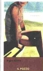
Il pozzo Regina Ezera Iperborea, 17 euro

Un incontro su un lago baltico tra un medico in vacanza e una donna locale. Cura del dettaglio e ritmo lento sul filo di un'attrazione ineluttabile in una atmosfera sospesa, quasi magica, sono i tratti di questo capolavoro della letteratura lettone.