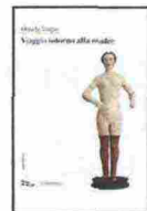
Viaggio intorno alla madre , di Ornella Vorpsi, (Nottetempo, pagg. 104, € 12,50; e-book € 7,99).

Cento pagine per raccontare i dilemmi di una madre. Che è anche moglie e donna. Katarina è bella, ha un figlio e un marito che l'adora, ma è ossessionata dal suo giovane amante. Quando il bambino si ammala proprio la notte che precede l'incontro con lui, la domanda erompe: conta più il mio bambino o la passione? Per chi sarei disposta a morire? Il dilemma è il solito: l'amore che impone rinunce, l'arrivo di un bimbo che, spesso, spegne la coppia. (C.V.)