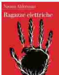
Naomi Alderman «Ragazze elettriche» Nottetempo

Roxy ha 14 anni ed è la prima ad avvertire alcune "punture di luce dalla spina dorsale fino alla clavicola, dalla gola ai gomiti fino ad arrivare ai polpastrelli" che le permettono di adoperare "una torsione, come se da sempre sapesse come funziona" contro l'uomo che la stava aggredendo. Forse a causa dell'inquinamento o forse la riappropriazione di un'abilità persa nell'evoluzione ed ora nuovamente acquisita, in un tempo indefinito ma ipoteticamente molto vicino al nostro, le donne scoprono di essere in grado di emanare scariche elettriche tali da uccidere l'uomo colpito. La narrazione dell'esperienza di Roxy si interrompe bruscamente e la storia precipita in Nigeria dove Tunde assiste a questo sopruso in