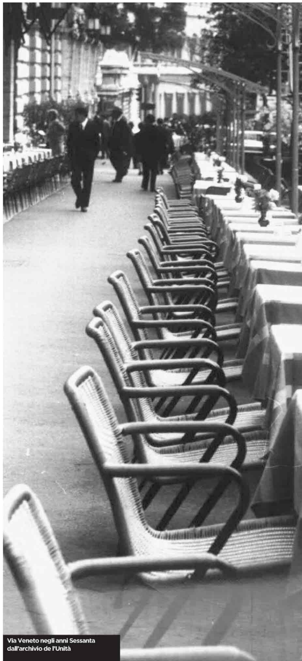
Via Veneto negli anni Sessanta