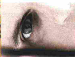
ROMANZO V.M. GIAMBANCO DELLA PRIMA FINE