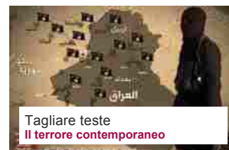
Tagliare teste Il terrore contemporaneo