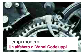
Tempi moderni Un alfabeto di Vanni Codelluppi