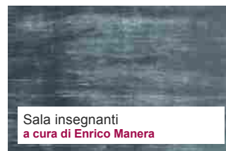
Sala insegnanti a cura di Enrico Manera