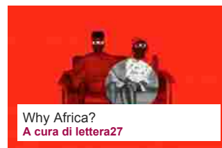
Why Africa? a cura di lettera27

Come sa, nella maggior parte delle forme di teologia politica è anche in questione la fine del mondo, l'apocalisse: ancora nel romanzo del 2012 di Jérôme Ferrari, insignito del Premio Goncourt, Le sermon sur la chute de Rome [Il sermone sulla caduta di Roma, trad. it. A. Bracci, ed. E/O], questo tema viene trattato con insistenza, in riferimento ad Agostino. Credo che il naufragio della Costa Concordia , su cui Jean-Luc Godard aveva girato una parte del suo penultimo lavoro Film Socialisme (2010), sia stato percepito come un cattivo presagio apocalittico, non da ultimo perché pochi mesi dopo l'avaria si sarebbe celebrato l'anniversario dei cento anni dall'affondamento del Titanic . La retorica della catastrofe fa senza dubbio parte dei temi più attuali e, letteralmente, brucianti di una scienza della cultura come disciplina diagnostica del nostro tempo. Nel film di Godard la Costa Concordia è anche un simbolo delle crociate e dell'abbruttimento dello spirito mediterraneo, che Albert Camus o Cesare Pavese, ancora negli anni '40 del XX secolo, avevano evocato come fonte originaria dell'identità europea. Già al primo minuto del film