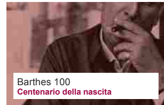
Barthes 100 Centenario della nascita

La morte rimane un enigma esistenziale, anche per le Humanities , che operano al di là dei rituali religiosi e