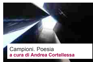
Campioni. Poesia a cura di Andrea Cortellessa