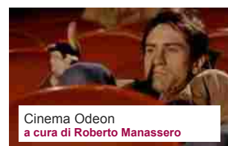
Cinema Odeon a cura di Roberto Manassero