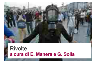
Rivolte a cura di E. Manera e G. Solla