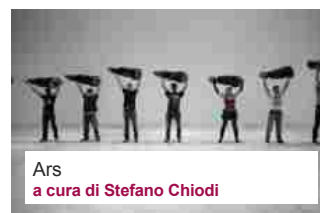
Ars a cura di Stefano Chiodi