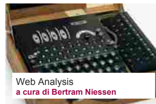
Web Analysis a cura di Bertram Niessen