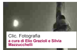
Clic. Fotografia a cura di Elio Grazioli e Silvia Mazzucchelli