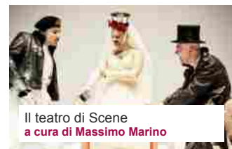
Il teatro di Scene a cura di Massimo Marino