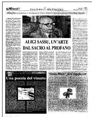
figure di passaggio: "sono io, sei tu, su quello scooter, / in attesa che lei almeno una volta ci degni". Fantasmi di un'epoca di solitudini incrociate, la pietà per una foto sulla strada nel luogo dell'incidente. Ma la vita è anche la difesa degli affetti più intimi, i luoghi, le stanze della casa, i timori, ciò che ogni giorno ci appartiene nella consapevolezza di un bene: "ma che gioia, che respiro di sollievo, / la luce, rivedervi tutti".

Il discorso prosegue nelle altre due sezioni del libro: "In marcia" e "Guardia alta". Anche qui è un mondo straniato, quelli che ci stanno ancora una volta intorno nelle nostre giornate, a diventare protagonista. La strada e le sue insidie, le sorprese, le meraviglie di occhiate appena percepite: semplici