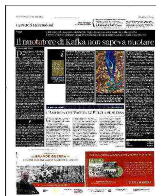
David Hockney (Bradford, Gran Bretagna, 1937), Diver / Tuffatore (1972, litografia a colori su carta, cm 99 x 62): uno dei manifesti celebrativi realizzati in cinque serie dall'artista inglese in occasione della XX Olimpiade di Monaco

Ritaglio stampa ad uso esclusivo del destinatario, non riproducibile.