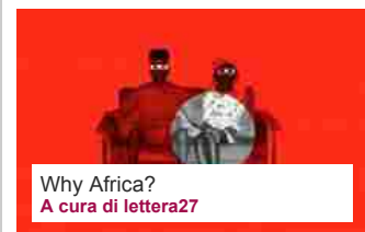
Why Africa? A cura di lettera27