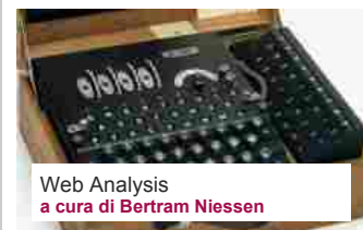
Web Analysis a cura di Bertram Niessen