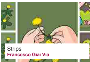
Strips Francesco Gai Via