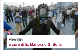
Rivolte a cura di E. Manera e G. Solla