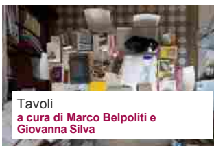
Tavoli a cura di Marco Belpoliti e Giovanna Silva