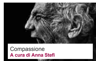
Compassione A cura di Anna Stefi