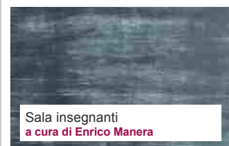
Sala insegnanti a cura di Enrico Manera