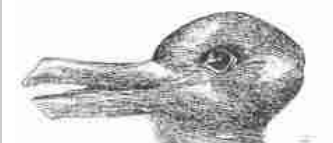
Contemporanea. Filosofia oggi a cura di Riccardo Panattoni