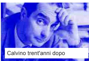
Calvino trent'anni dopo