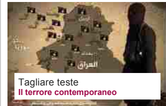
Tagliare teste Il terrore contemporaneo