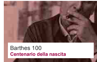
Barthes 100 Centenario della nascita

Nei Suoi ultimissimi testi prevale un tono che è stato variamente definito apocalittico, pessimistico, disfattistico e così via. In effetti, una strategia retorica essenziale all'idiota nelle sue varie forme (ben