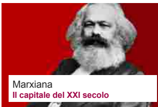
Marxiana Il capitale del XXI secolo