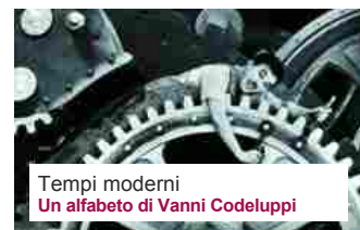
Tempi moderni Un alfabeto di Vanni Codeluppi