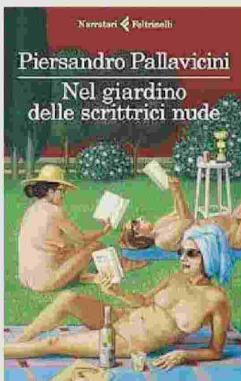
Piersandro Pallavicini «Nel giardino delle scrittrici nude» FELTRINELLI