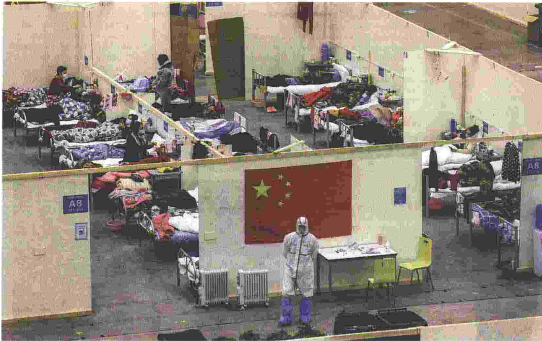
Un ospedale temporaneo allestito in una centro fieristico a Wuhan