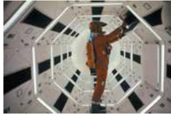
→ 2001 Odissea nello Spazio di Stanley Kubrick

mettono nella condizione di essere osservati e osservatori allo stesso tempo.