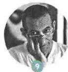
9 MAURIZIO MAGGIANI

Il suo nome è la storia della fotografia italiana. Il 13/9 alle 17.15, nell'Aula Magna dell'università, ne parla con la scrittrice Letizia Muratori. Per prepararsi, riempitevi gli occhi con il suo Diario (Castelvecchi), dalla natia Palermo alla Milano dei '70.