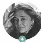
4 JORIE GRAHAM

Promette scintille, e fiumi di parole, l'incontro «Cantastorie contemporanei» (11/9, ore 16, Palazzo Ducale) tra Vinicio Capossela e lo scrittore «principe della Versilia», nonché autore di Chi manda le onde (Mondadori), arrivato in finale all'ultimo premio Strega.