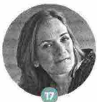
17 TRACY CHEVALIER

Lo hanno definito «il Sofocle del North Carolina» perché la sua narrazione si trasforma in coro greco. Presenta Anche le sante hanno una madre (Playground, in uscita il 15 settembre) il 13/9 alle 14.30 nella Casa del Mantegna.