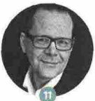
11 KARI HOTAKAINEN

È un «convertito», lo spagnolo autore dell' Impostore (Guanda): ha dichiarato, infatti, di avere capito che la realtà contiene in se stessa tutta la forza necessaria alla letteratura. Spiega l'equilibrio che è riuscito a trovare tra fiction e non fiction il 12/9 alle 18.30 al Teatro Ariston.