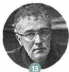
13 JOSEPH O'CONNOR

È l'autrice di fumetti del momento, la più poliedrica: si è occupata di Tamara de Lempicka, vampiri e Trieste: il 13/9 alle 11.15 in Aula Magna, parla in anteprima del nuovo La Bambina Filosofica - No Future (Bao Publishing, in libreria dal 13 novembre).