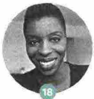
18 NOO SARO-WIWA

Quando ha iniziato a scrivere L'ultima fuggitiva (Neri Pozza), la scrittrice americana ha approfondito l'arte dei quilt, trapunte composte da ritagli di tessuti. Una metafora del raccontare storie: ne parla con Chicca Gagliardo il 9/9 alle 17.30 a Palazzo San Sebastiano.