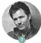
7 ANDRE DUBUS III

Meglio il romanzo, o meglio il racconto? Di questo discute l'autore di Terre rare e Non dirlo . Il Vangelo di Marco (Bompiani) con Mauro Covacich. Per gli appassionati di dilemmi insolubili, l'appuntamento è il 12/9, alle 10.15 a Palazzo Ducale.