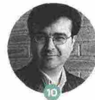
10 JAVIER CERCAS

Una vera epopea italiana Il Romanzo della Nazione (Feltrinelli), racconto maestoso e collettivo di come si diventa grandi, come uomini e come Paese. Lo scrittore ligure lo presenta il 13/9, ore 14.30 alla Basilica Palatina di Santa Barbara.