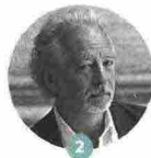
2 STEFAN HERTMANS

«Tra il dolore e il nulla, scegliere il dolore». A dirlo, William Faulkner, in chiusura delle Palme selvaggio (1939). Il filosofo di Esperienze del dolore (Raffaello Cortina) spiega (11/9, ore 21, Tenda Sordello) la differenza tra dolore (oggettivo) e sofferenza (soggettiva).