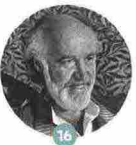
16 ALLAN GURGANUS

Il suo ultimo libro Riparare i viventi (Feltrinelli) è tra i più belli usciti quest'anno (ed è già in lavorazione un film basato sulla storia del trapianto di cuore). L'incontro con l'autrice francese è il 13/9 alle 10.15 alla Basilica Palatina di Santa Barbara. Imperdibile.