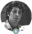
6 SANDRO VERONESI

Con Luce perfetta (Einaudi) ha concluso la trilogia, sarda e italiana, sulla famiglia Chironi, iniziata con Stirpe seguito da Nel tempo di mezzo . L'11/9, alle 21.15 al Seminario Vescovile, si confronta con l'inglese Charles Lambert, a sua volta autore di una saga ambientata a Roma.