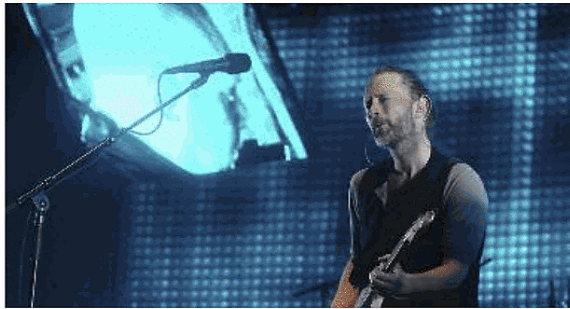
Il leader dei Radiohead, Thom Yorke