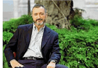
Arturo Pérez-Reverte Con Settecolori

ti. Focus anche sull'identità di genere e il tema della transizione con un seminario dello scrittore Paul B. Preciado e la presentazione del libro Trans. Una poetica del paradoss (Nero) di Sandra Cane. La crisi del genere maschile è invece al centro di Quel che resta degli uomini di Manolo Parci (nottetempo). Molte anche le proposte editoriali che ruotano intorno al rapporto tra generazioni, con le presentazioni dei volumi L'idiota di famiglia di Dario Ferrari (Sellerio) e La sonnambula di Bianca Pitzorno (Bompiani) e ancora Daria Bignardi con Nostra solitudine (Mondadori).