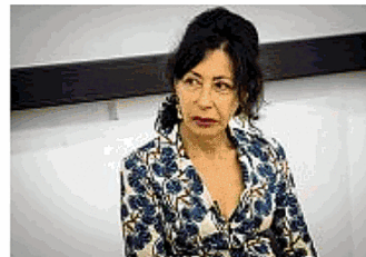
Yasmina Reza Con la casa editrice Adelphi