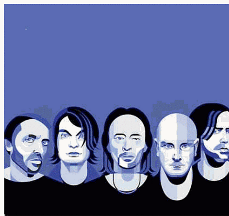
L'immagine di copertina del libro sui Radiohead

Rennis, perché ha scelto proprio il brano dei Radiohead «Pop is dead» per dare il titolo al libro? Non è tra i miei brani preferiti, anzi, probabilmente è tra quelli che detesto di più. Mi interessava però il significato che porta con sé, perché raccontando la storia dei Radiohead ci si rende conto di come abbiano ucciso più volte il pop allo scopo di allungargli la vita e, forse, addirittura garantirgli l'immortalità. Questo libro è frutto di una serie di interviste a collaboratori e amici della band. Come ha colle-