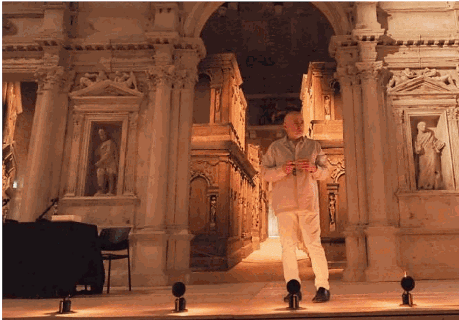
L'Olimpichetto A terra alcuni "Lumi olimpici" ideati da Mario Nanni con una base pesante e cera ecologica

Il punto di partenza è un progetto, presentato alla Comunità Europea come ricerca interdisciplinare, che racchiude una critica esplicita al museo contemporaneo inteso come "bel contenitore": quattro pareti, luci dall'alto, opere appese come immagini intercambiabili. «Un mo-