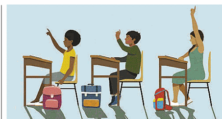
In classe

OCCORRE ROVESCIARE questo modello. Ed è interessante il rinvio che gli autori fanno alla «verifica dei poteri» secondo la lezione di Franco Fortini. Tale verifica è intesa come analisi dei meccanismi decisionali e dei rapporti di forza per individuare i punti di fragilità del potere che noi stessi alimentiamo. In quest'ottica le «tecniche di resistenza» non sono proteste astratte, ma azioni fondate sulla conoscenza dei regolamenti, sulla riappropriazione della funzione deliberativa dei Collegi, sul rifiuto di compiti burocratici che esulano dall'insegnamento e sulla costruzione di un rapporto differente con gli studenti, anch'essi condizionati da una competizione costante sulla performance . Troviamo qui una prima contraddizione: quella tra il desiderio di educare e l'obbligo di compilare report che non dicono nulla della realtà dell'aula. Solo abitando operativamente questa tensione il dissenso può uscire dalla lamentela privata, si sostiene nel libro. Il problema resta la distanza tra la lucidità della denuncia e la sua effettiva capacità di incidere. La critica ai neoliberalismi è rimasta un esercizio prevalentemente analitico. Oggi l'urgenza è verificare la tenuta di quelle idee nel vivo del lavoro. In questo passaggio politico si avvertono le difficoltà maggiori ed è sui modi di affrontarle che il libro spinge a interrogarsi.