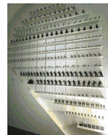
Installaz. di silhouettes per il film «Orfeo» di Villoresi

PRESCINDENDO da analisi più approfondite, che pure la mostra dà l'estro di compiere per certe posture originali con cui propone i suoi oggetti, l'immediato giudizio sintetico che spinge a formulare riguarda proprio la complessiva figura di Dino Buzzati, che appare qui nel suo prodigioso talento nell'intercettare cultura pop e colta. Forse sarà stata la sua facilità di scrittura, forse davvero una sensibilità rara nel tradurre e mediare da un registro all'altro, certo è che Buzzati dà precocemente forma a una in-