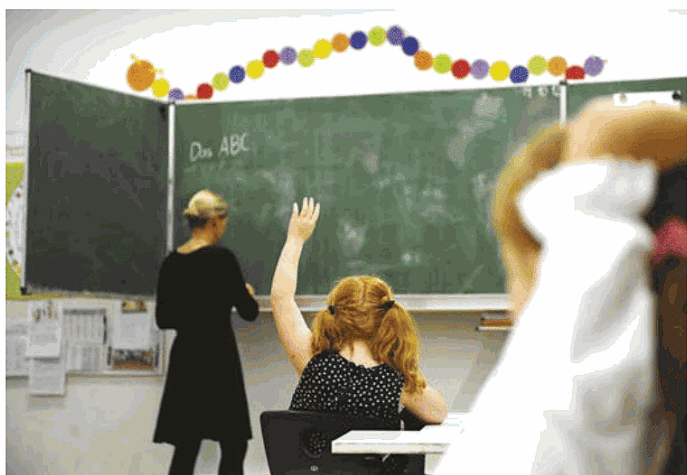
Scuola foto Ap

A proposito del volume «Contro la scuola neoliberale»