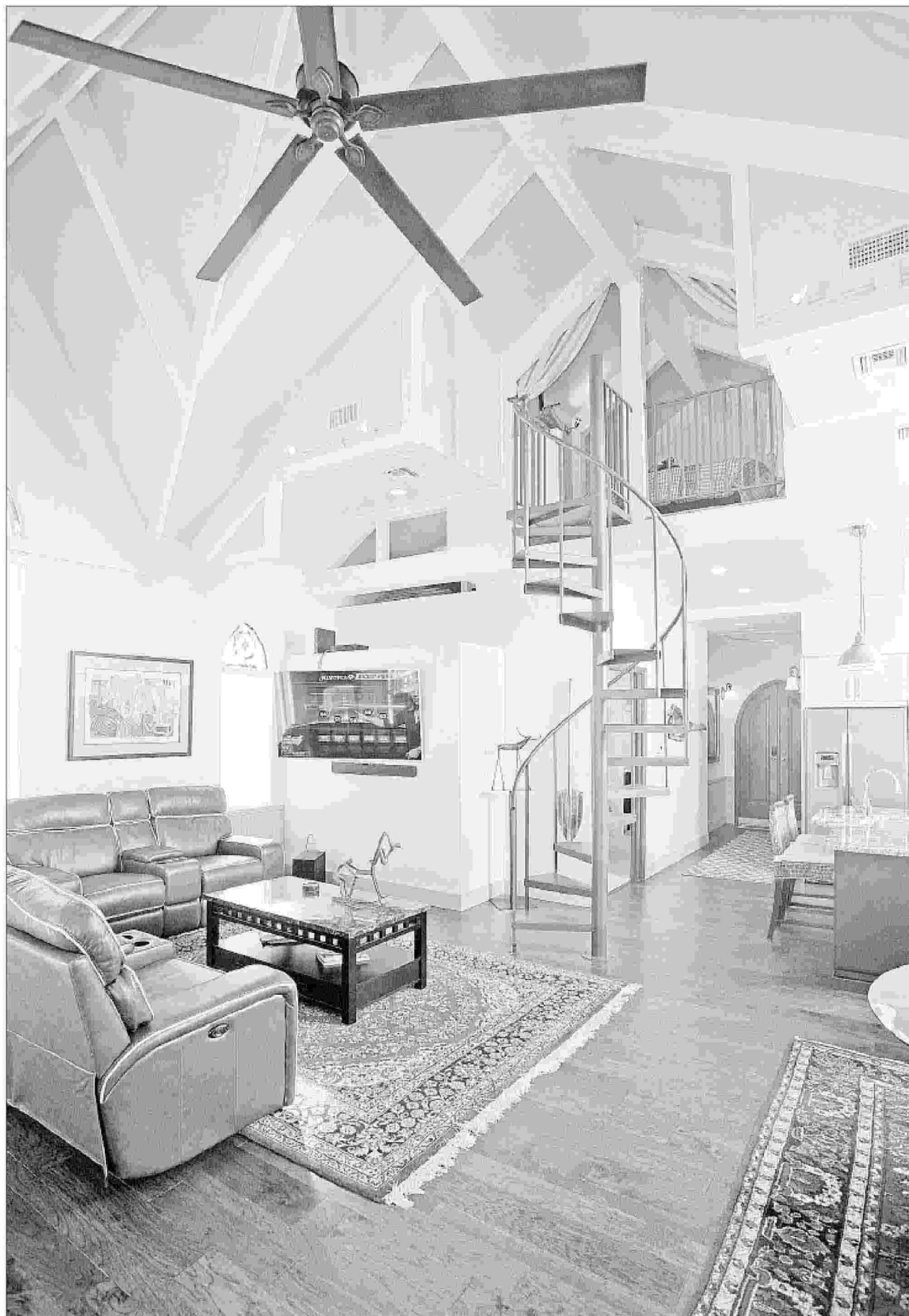
In tv ci sono decine di programmi come "Interior Design Masters", "Selling Sunset", e poi il famosissimo "House Hunters"

Ritaglio stampa ad uso esclusivo del destinatario, non riproducibile.