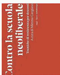
“Contro la scuola neoliberale” di Mimmo Cangiano, nottetempo, 156 pagine, 16 euro

Andare “contro la scuola neoliberale” insegna a non stare dietro al mercato