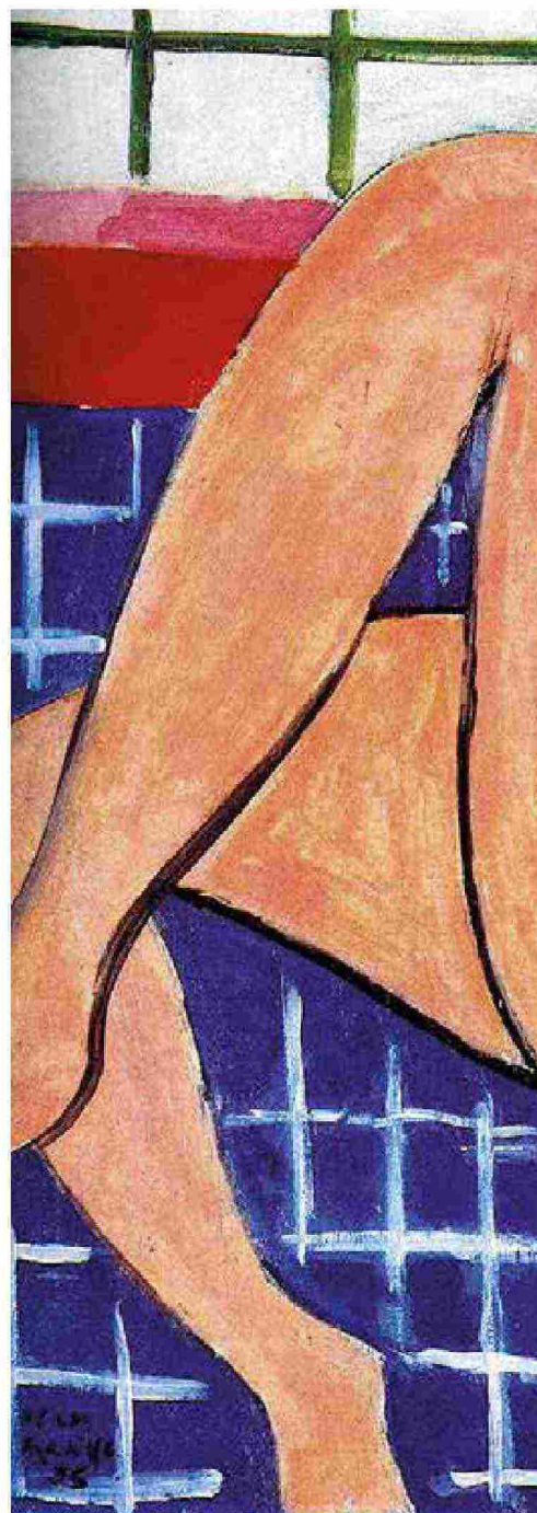
Nuco (1935) Dipinto di Henri Matisse

L e parole, le immagini, le metafore con cui una cultura definisce la vita ai propri margini rivelano le trame inconfessate che innervano ciò che essa considera "normalità": sono la sfera simbolica che giustifica le relazioni di potere tra gli individui e tra essi e le istituzioni. Negli anni Settanta, costretta alla degenza per un tumore che l'aveva colpita, Susan Sontag riflette sulle figure e le metafore che descrivono la malattia, raccoglie le parole che circondano il cancro e nota come esse operino nell'immaginario comune una sottile degradazione del malato. In seguito, ripeterà l'operazione con l'Aids, trovando conferma rispetto all'inconfessata immaginazione punitiva che travolge malattia e malato. Pubblica allora Malattia come metafora e L'Aids e le sue metafore (che Nottetempo ha da poco ripubblicato dopo la prima edizione Einaudi), in cui mette in evidenza proprio il tenore politico del linguaggio che struttura le malattie, sempre meno empatico e sempre più incentrato su una sottile e implicita strategia di accusa del malato, la cui vulnerabilità è descrivibile come un deficit morale.