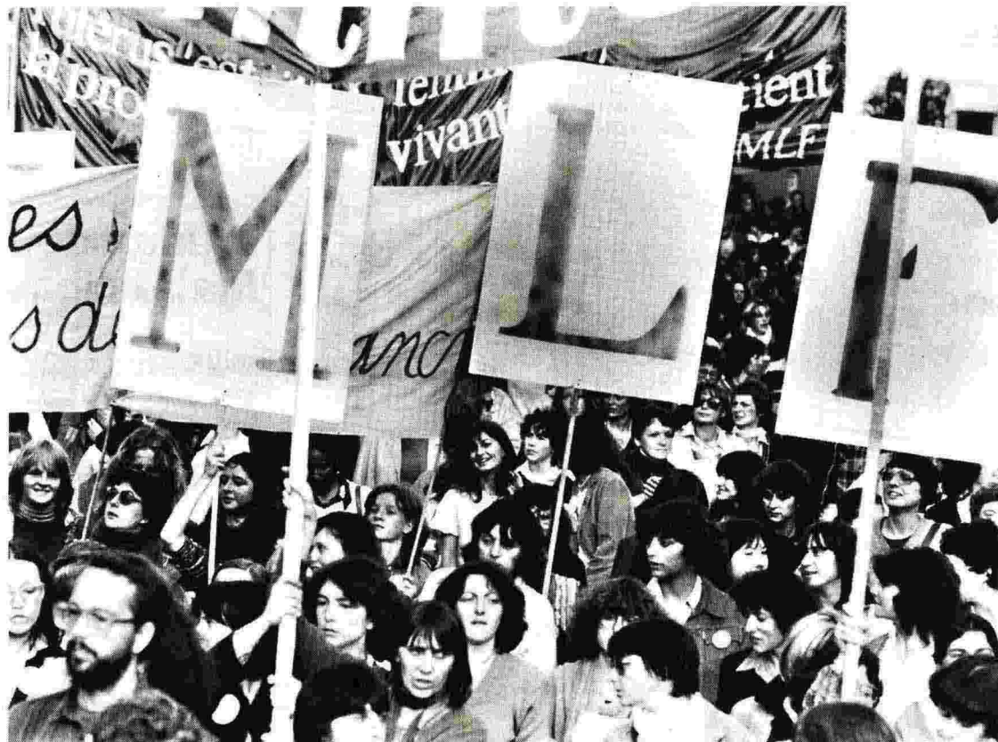
Una manifestazione del «Mouvement de libération des femmes» (1970). Accanto un ritratto dell'intervistata

Mi piace dire che sono «una» Sisifo, sempre pronta a ricominciare il lavoro di costruzione dell'emancipazione