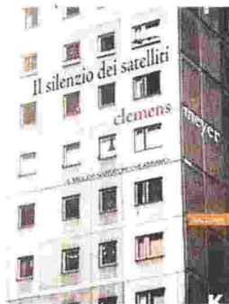
Il silenzio dei satelliti | Clemens Meyer Keller editore | 223 pagine | 16,50 euro

guardando il Mar Baltico e un fantino fallito col sogno di gareggiare sul lago ghiacciato... Battaglie perse e desideri travolgenti, le mille facce del nostro tempo: immigrazione e povertà, disagio e sofferenza, amore e speranza.