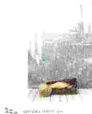
Impalcature | Mario Benedetti nottetempo editore | 329 pagine | 16 euro