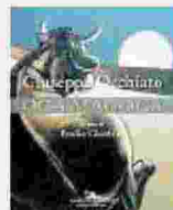
GIUSEPPE OCCHIATO Oga Magoga GANGEMI 1200 pagine 50 euro