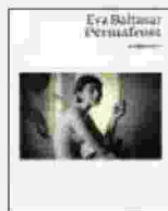
EVA BALTASAR Permafrost NOTTETEMPO 128 pagine 16 euro

Per stomaci forti è invece Requiem per un sogno di Hubert Selby Jr, libro del 1978 ripubblicato ora da Sur. Qui siamo a New York negli Anni '70 e grazie a una prosa schizofrenica e sinopata seguiamo la lenta e inesorabile discesa all'inferno di quattro personaggi che si autodistruggeranno inseguendo il Sogno Americano. Da quest'opera di Selby jr nel 2000 è stato tratto l'omonimo film di Darren Aronofsky.