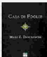
MARK Z. DANIELEWSKI Casa di foglie 66THAND2ND 760 pagine, ill. 29 euro