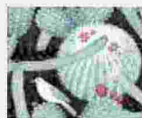
CEES NOOTEBOOM 533. Il libro dei giorni IPERBOREA 234 pag. 16,50 euro