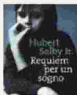
HUBERT SELBY Requiem per un sogno BIGSUR 317 pagine 18 euro

E cce tre titoli legati tra loro dal filo rosso del disagio e dell'inadeguatezza. O, più in generale, dalla difficoltà di stare al mondo. Ha il suono del lamento l'esordio della poetessa catalana Eva Baltasar che con Permafrost (ed. Nottetempo), presta la sua voce a una quarantenne senza nome costretta a vivere costantemente in bilico tra amore e morte. Libro ironico e sarcastico, a tratti spassoso nonostante la complessità dei temi trattati, il romanzo è ambientato tra Barcellona, Scozia e Bruxelles ed è un lungo monologo che descrive gli stati d'animo di una giovane donna i cui frammenti di vita sono scanditi da maldestri quanto improbabili tentativi di suicidio. Giovane e tormentata è anche Eily, protagonista di Bohémien minori , romanzo di formazione ambientato negli Anni '90 in una Londra sdrucita e ostile (La nave di Teseo), in cui la scrittrice irlandese Eimear McBride narra le vicende di un amore tormentato tra una studentessa di recitazione e un attore di 20 anni più grande.