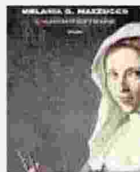
MELANIA G. MAZZUCCO L'archittrice EINAUDI 568 pagine 22 euro

P er riscoprire l'ineludibilità del sacro nelle nostre vite suggeriamo il bellissimo (anche come oggetto) Neil MacGregor, Vivere con gli dèi , Adelphi, viaggio imperdibile tra le fedi e i riti dei popoli. Con la sua scrittura fluviale dotata di rara trasparenza visiva, Melania Mazzucco ne L'archittrice , Rizzoli, ci immerge nel Seicento torbido e maestoso in cui la capitale assume la sua definitiva forma monumentale raccontando la vita di Plautilla Bricci, primo architetto della storia. Massimo Montanari entra in modo denso e spassoso nel dibattito tra sovranisti e globalisti con Il Mito delle Origini . Breve storia degli Spaghetti al pomodoro, Laterza. Smontando la fake news, risalente a Marco Polo, secondo cui la pasta è stata importata a Venezia dalla Cina, ricorda a tutti come il nostro piatto identitario unisce due elementi che non sono affatto italiani. Ancora per chi ama la storia consigliamo Le verità nascoste. Trenta casi di manipolazione della storia , Rizzoli, dove Paolo Mieli sfata le mistificazioni di diverse epoche dalla rivolta di Spartaco fino alla guerra di Corea ricordando a tutti però che "il sano esercizio della dimenticanza" favorisce i processi di pacificazione. È infine una scelta originale quella dell'audio libro riscoprendo così il grande Philip Roth grazie al visionario romanzo fantapolitico Il complotto contro l'America , Emons, letto da Francesco Montanari.