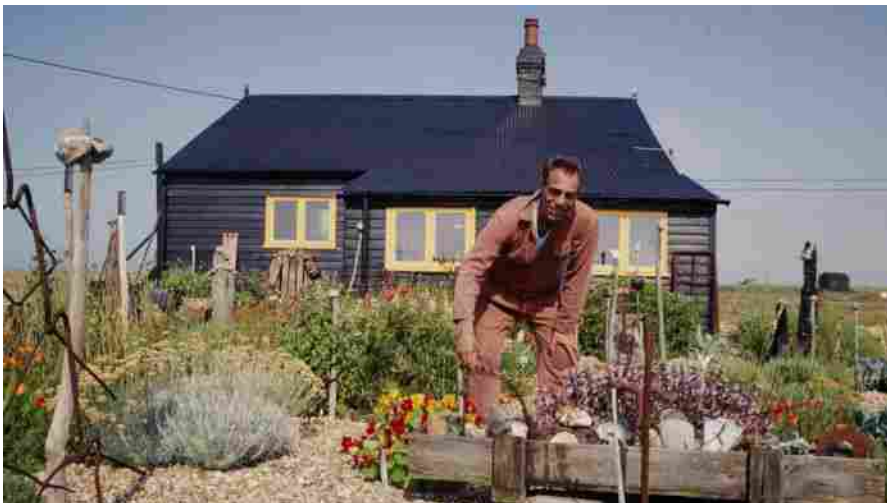
Derek Jarman at Prospect Cottage, Dungeness

È STATA AVVIATA UNA RACCOLTA FONDI PER SALVARE UN COTTAGE SU UNA SPIAGGIA DEL KENT, IN INGHILTERRA, CHE SORGE PROPRIO DI FRONTE ALLA CENTRALE NUCLEARE DI DUNGENESS. COSA HA DI SPECIALE QUESTA PICCOLA CASA VITTORIANA DI PESCATORI? SI TRATTA DELL'ULTIMA DIMORA DI DEREK JARMAN, REGISTA VISIONARIO, ARTISTA E ATTIVISTA BRITANNICO.